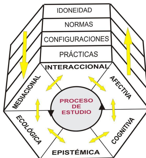
Figura 1. Facetas y niveles de análisis didáctico

“La enseñanza es relacional. Los profesores, los estudiantes, y el contenido sólo se pueden comprender unos en relación a los otros. El profesor trabaja para orquestrar el contenido, las representaciones del contenido, y las interrelaciones de las personas que intervienen en la clase. Los modos de estar de los estudiantes, sus formas de participación, y su aprendizaje emerge de estas relaciones mutuamente constitutivas. La enseñanza es también multidimensional” (Frankle, Kazemi y Battey, 2007, p. 227)